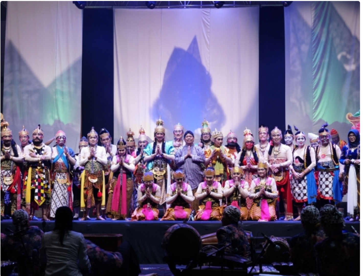
Foto bersama para Dewan Profesor ITS yang berperan dalam wayang Sang Wisanggeni

SURABAYA – Institut Teknologi Sepuluh Nopember (ITS) kembali menghadirkan pertunjukan wayang dalam rangkaian kegiatan Dies Natalis ke-62. Tak hanya menampilkan wayang kulit, gelaran yang bertempat di Gedung Pusat Robotika ITS ini turut mempersembahkan penampilan para Dewan Profesor (DP) yang berlakon dalam wayang orang bertajuk Sang Wisanggeni secara apik pada Sabtu